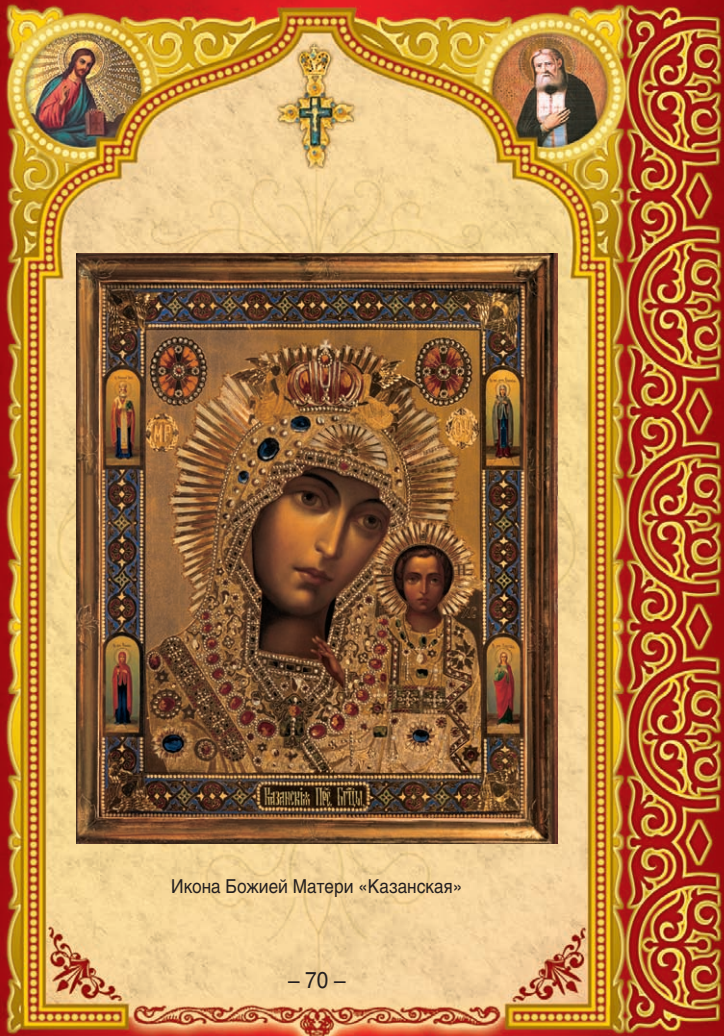
Икона Божией Матери «Казанская»