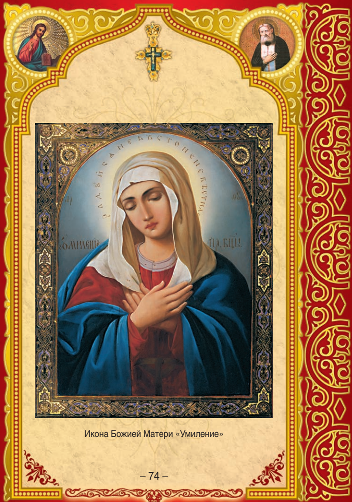
Икона Божией Матери «Умиление»