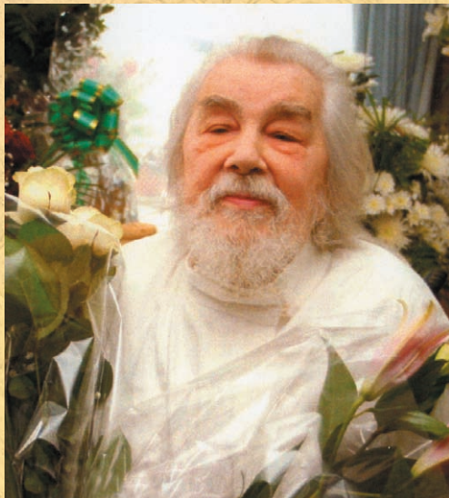
Архимандрит Иоанн (Крестьянкин) Свято-Успенский Псково-Печерский монастырь