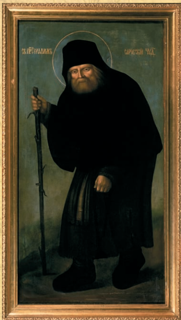
Прижизненное изображение преподобного Серафима Саровского