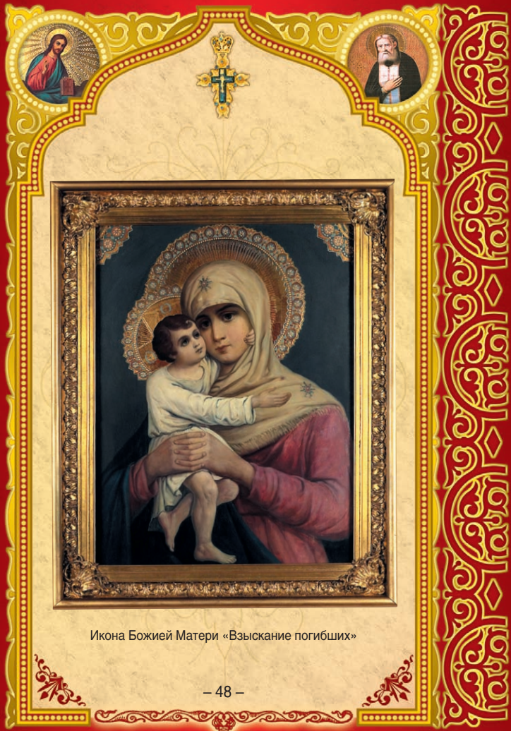
Икона Божией Матери «Взыскание погибших»